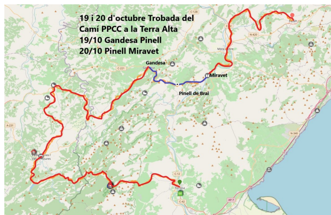
El Camí per les terres de l'Ebre