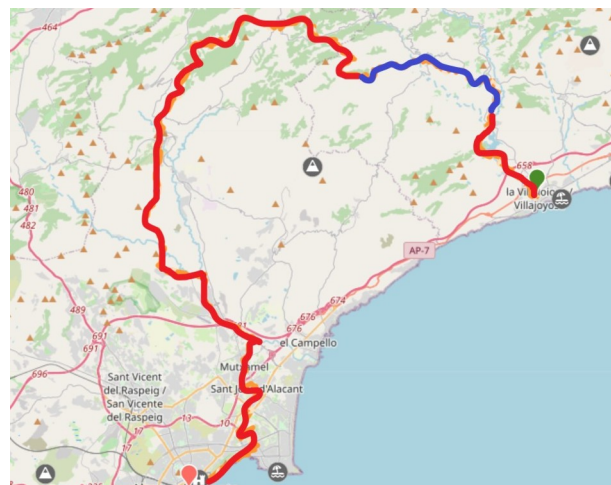
El Camí a la Marina Baixa i l'Alacantí