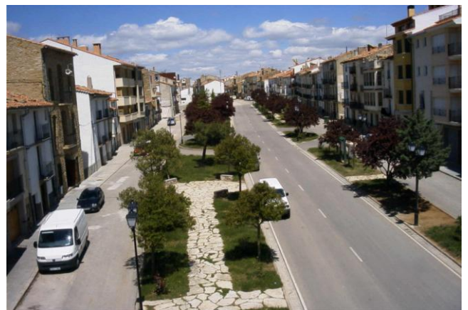
Avinguda del Llosar