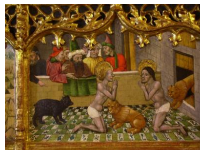
Fragment del Retaule de Valentí Montoli