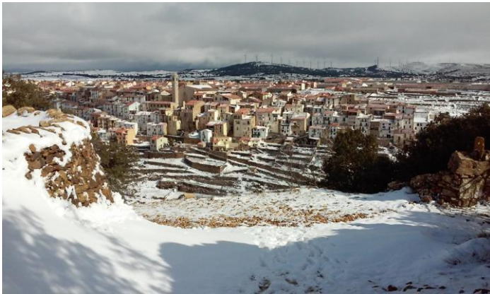
Vista general de Vilafranca