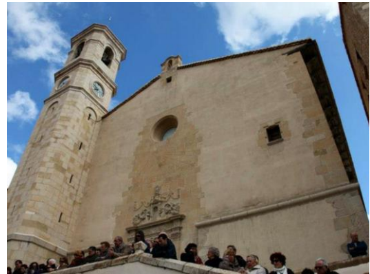
Església de Vilafranca