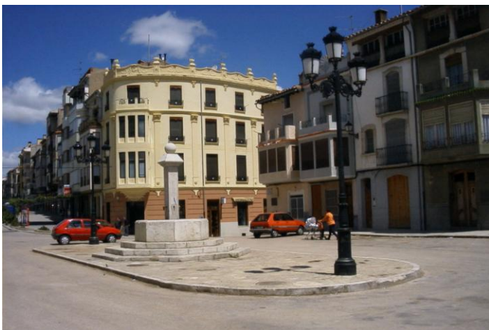
Plaça En Blasc