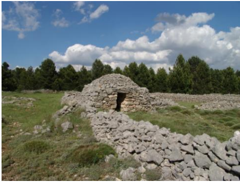
Construccions de pedra en sec