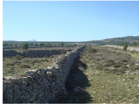
Assagador de Vilafranca