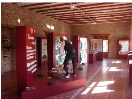
Museu de la pedra en sec