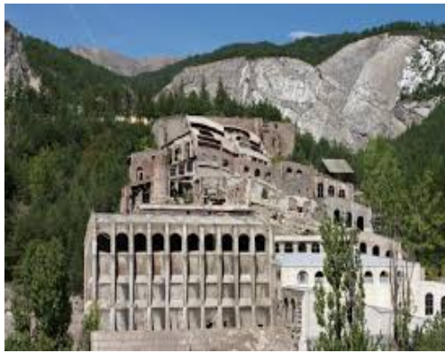
La Fàbrica Museu del Ciment Asland ( Castellar de n'Hug )