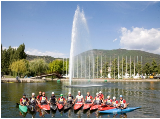
Parc del ssegre ( La Seu d'Urgell )