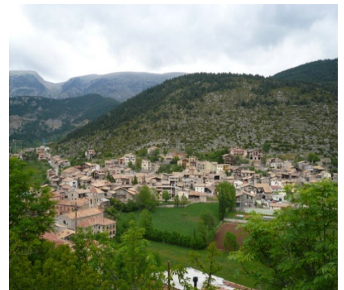
Gósol des del castell