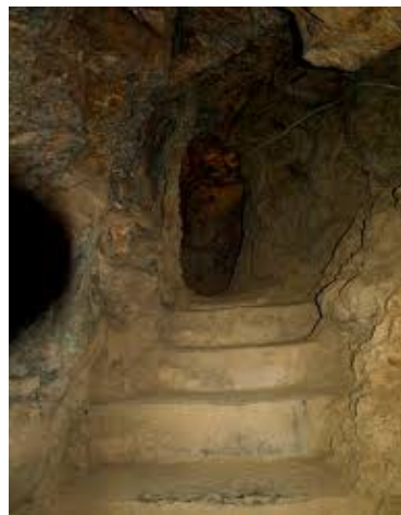
el Parc dels Búnquers de Montellà i Martinet