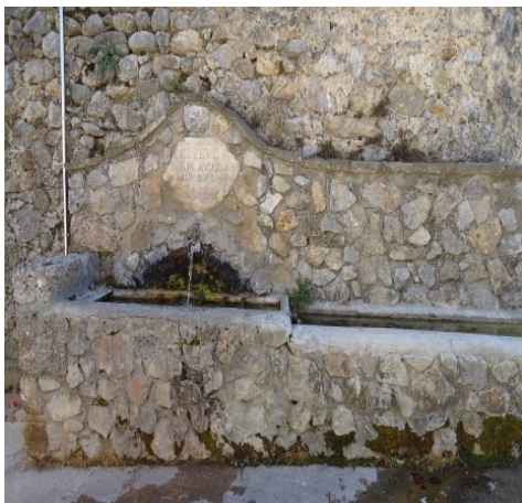
Font de coll ( Tuixent )