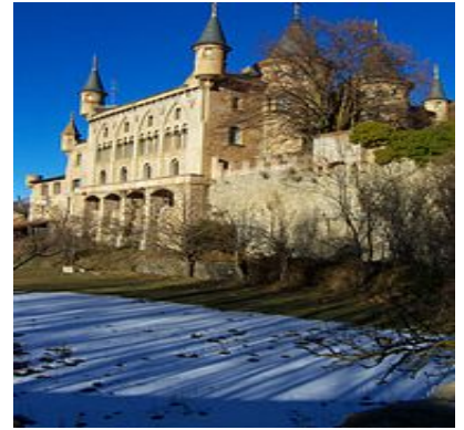
Torre del riu de l'Alp La obra historicista del tombant entre el segle XIX i el XX, declarada Bé Cultura d'Interès Nacional.