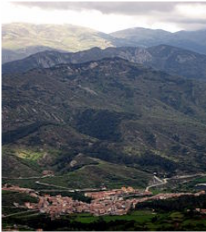
La Pobla de Lillet des del santuari de falgars.