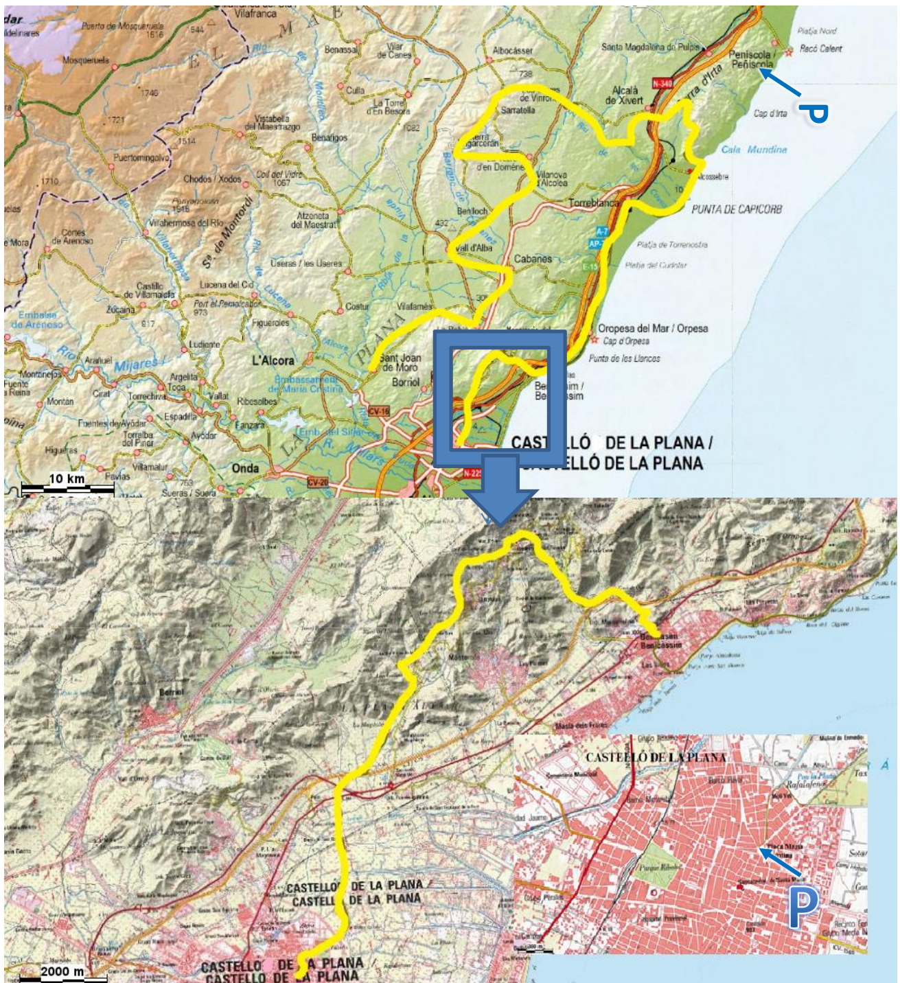
Castelló de la Plana Benicàssim El Camí al Desert - Irla - Pla de l'Arc